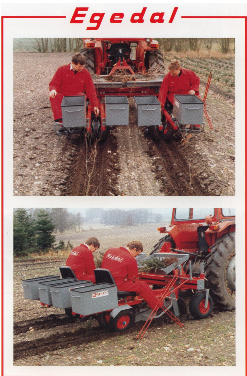
Masina de plantat model JT profesional

In cazul masinii de plantat model JT standard, scaunele pot fi montate in doua pozitii diferite: pozitionate central fie orientate spre directia de mers fie in sens invers acestei directii. In acest fel se pot planta fara probleme si puietii de dimensiuni mai mari.